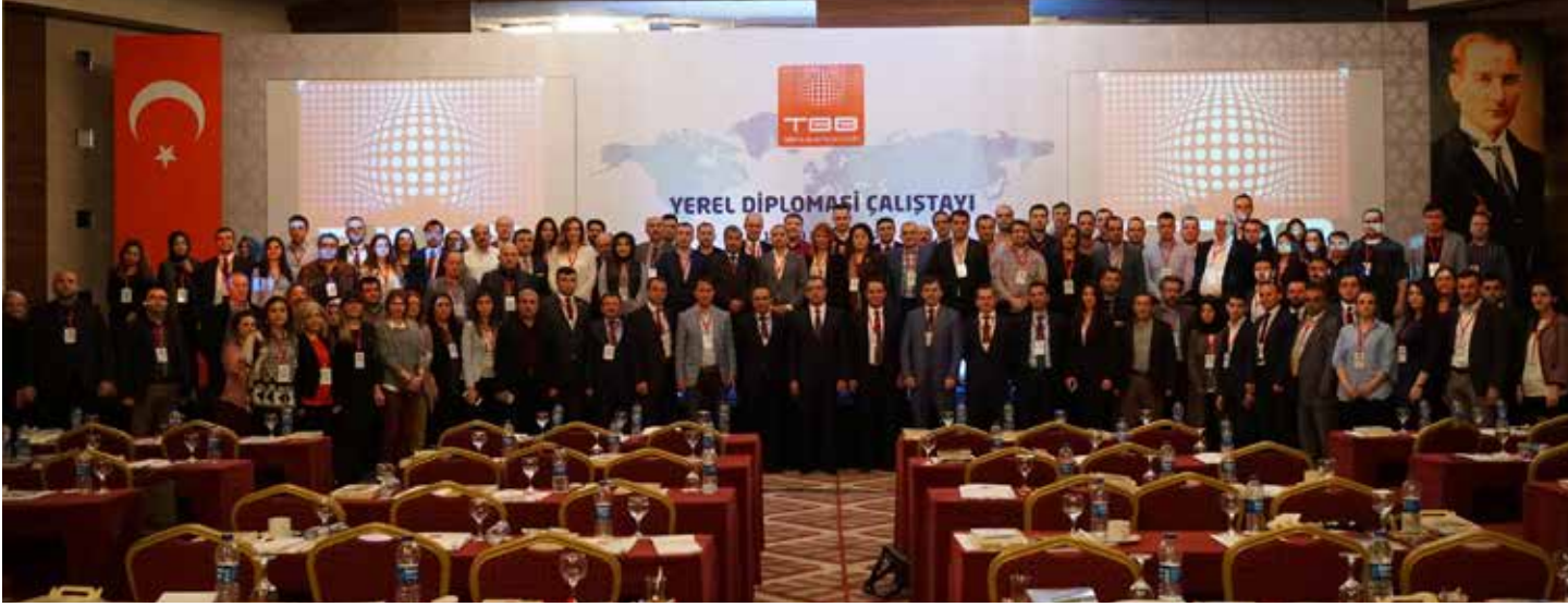
Şekil 7: TBB Yerel Diplomasi Çalıştayı

Uluslararası ilişkiler hizmetleri kapsamında TBB, yurt içinde ve yurt dışında belediyeleri temsil etmek, yerel yönetimler konusundaki uluslararası gündemi takip etmek, yönlendirmek, dünyadaki iyi uygulamalara yönelik bilgi ve deneyim paylaşımını sağlamak, doğal veya toplumsal olaylardan etkilenen belediyelere destek olmak ve dayanışmayı teşvik etmek amacıyla çeşitli çalışmalar yürütmektedir.