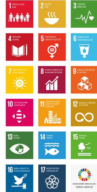
Şekil 11: Birleşmiş Milletler