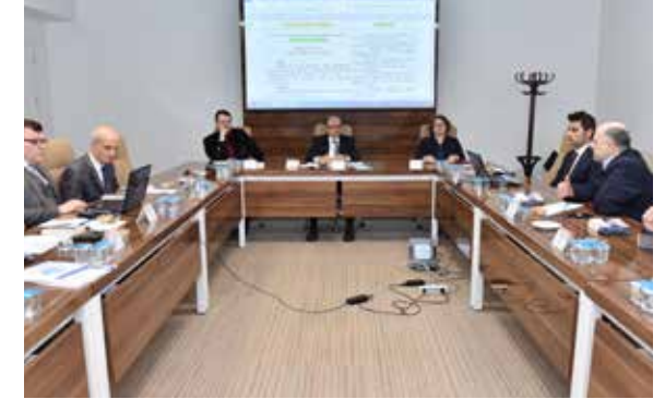
Şekil 2: TBB'nin hukuk alanındaki toplantılarından bir fotoğraf

Bu hizmetler, Anayasa'nın 90'ıncı maddesine göre kanun hükmünde olan Avrupa Yerel Yönetimler Özerklik Şartı'nın 4'üncü maddesinde yer alan "Yerel makamları doğrudan ilgilendiren tüm konulara iliřkin planlama ve karar alma süreçleri içinde, kendileriyle olanaklar ölçüsünde zamanında ve uygun biçimde danıřılacaktır." hükmü ve Mevzuat Hazırlama Usul ve Esasları Hakkında Yönetmelik'in 6'ıncı maddesinde yer alan "Taslaklar hakkında konuyla ilgili mahallî idareler[in] ... görüşlerinden de faydalanılır." hükmü ile uyumludur. TBB'nin belediyelerin çıkarlarının korunmasına iliřkin görevleri, ařađıdaki temel ilkeler esas alınarak yürütölmektedir: