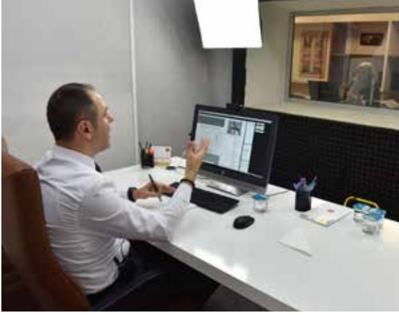
Şekil 5: TBB uzaktan eğitim merkezinden bir fotoğraf

TBB eğitim faaliyetleri kapsamında yakın zamanda uygulamaya sunulan ve 2017 yılında fizibilite çalışmaları tamamlanan “Uzaktan Eğitim Merkezi” ile belediye personelinin mekândan ve zamandan bağımsız olarak sürekli ve güncel eğitim almasını sağlayacak eğitim faaliyetleri yürütülmeye başlanmıştır.