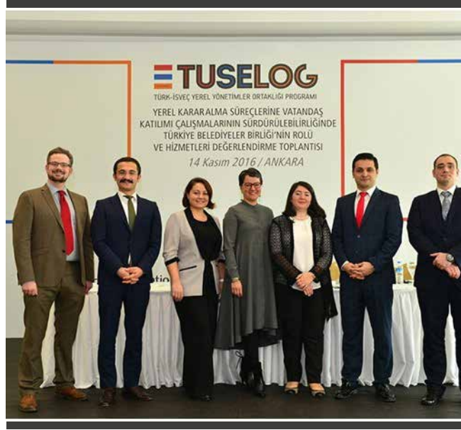
Şekil 8: TUSELOG projesinden bir fotoğraf

Belediyelerimiz, TUSENET Projesi kapsamında uyguladıkları pilot projelerle hem kendi aralarında hem de İsveç belediyeleri ile deneyim paylaşımında bulunmuşlar, bir yandan kapasitelerini geliştirirken diğer yandan iki ülke yerel yönetimleri arasında kalıcı dostluk ve güven ortamının oluşumuna katkı sağlamışlardır. Projede Türkiye'nin farklı coğrafi bölgelerinden, farklı ölçeklerdeki belediyeler bir araya gelerek birlikte çalışma kültürünü de geliştirmişlerdir. Pilot projelerin katılımcı bir yöntemle hazırlanması, projelerin başarılı bir şekilde sonuçlandırılmasına büyük katkı sağlamıştır.