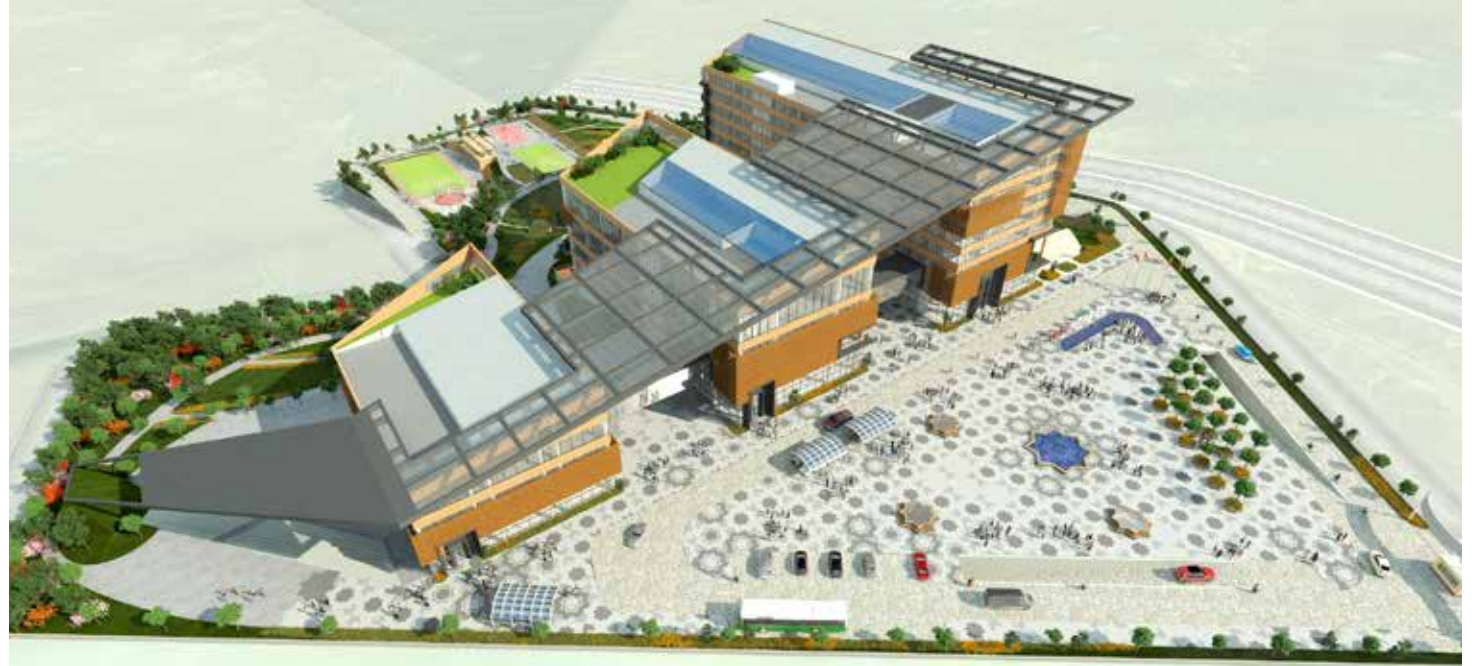
Şekil 6: Belediye Akademisi Yerleşkesi mimari tasarımı

“ Ulusal ve uluslararası meslek standartlarını esas alan TBB; teknik ve mesleki eğitim standartlarının ve yeterliliklerin geliştirilmesi, uygulanması ve bunlara ilişkin akreditasyon alınması için çalışmalarına devam etmektedir. ”