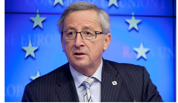
Jean-Claude Juncker (AB Komisyonu Başkanı)