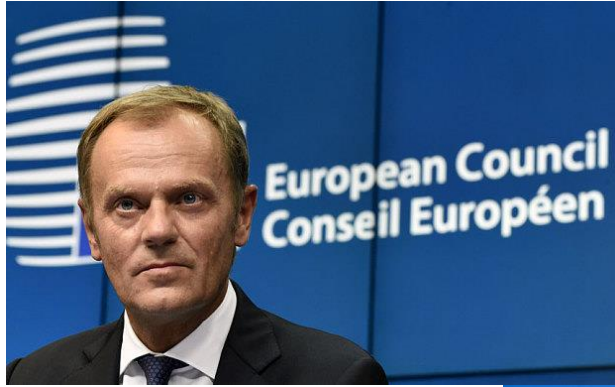
Donald Tusk (AB Konseyi Başkanı)