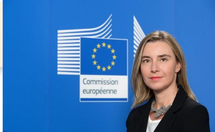
Federica Mogherini (Dış İlişkiler ve Güvenlik Politikası Yüksek Temsilcisi)